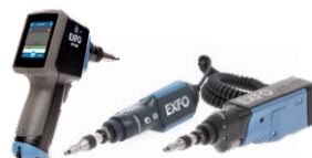
光纤端面检测器 FIP-500, FIP-400B (Wi-Fi 或 USB)