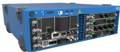
LTB-8八插槽机架式平台