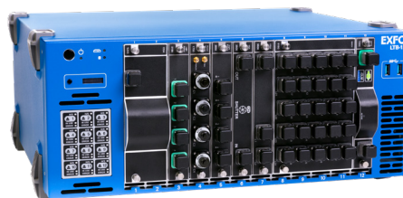
LTB-12十二插槽机架式平台