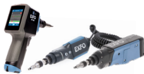
Microscope d'inspection de fibres FIP-500 et FIP-400B ( Wi-Fi or USB )