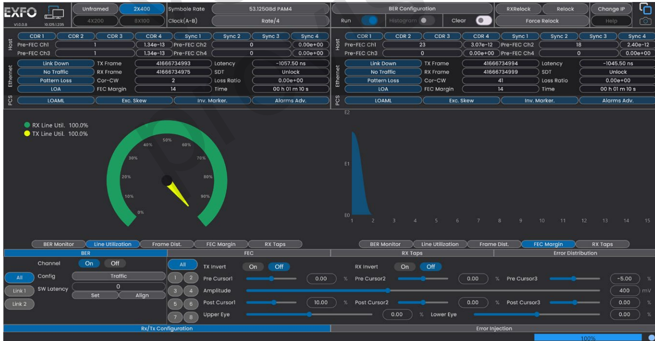
Figure 4. Test du TEB FEC avant/après, distribution de l'erreur de symbole et marge FEC.

Surveillez les paramètres clés tels que le nombre de trames Rx/Tx et l'utilisation des lignes. L'analyse FEC en temps réel permet de tester le BER avant/après FEC, la distribution des erreurs de symbole et la marge FEC.