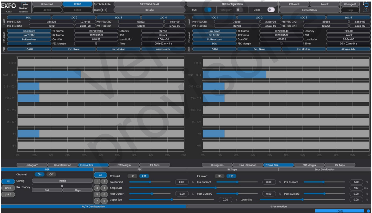
Figure 2. Interface graphique conviviale.

L'interface utilisateur graphique (GUI) du BA-4000-L2 fournit des résultats de test simplifiés et en temps réel pour chaque canal. Elle nécessite un PC externe basé sur Windows avec une capacité Ethernet pour exécuter l'interface graphique et l'API.