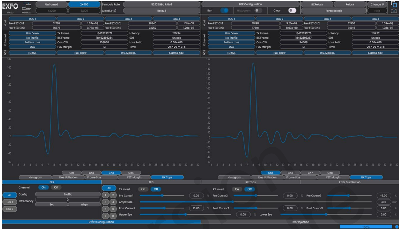
Figure 3. Détecter l'ISI et la réflexion lointaine.

Le BA-4000-L2 prend en charge un égaliseur feed-forward (FFE) jusqu'à 32 tours. Il détecte les interférences intersymboles (ISI) et les réflexions lointaines.