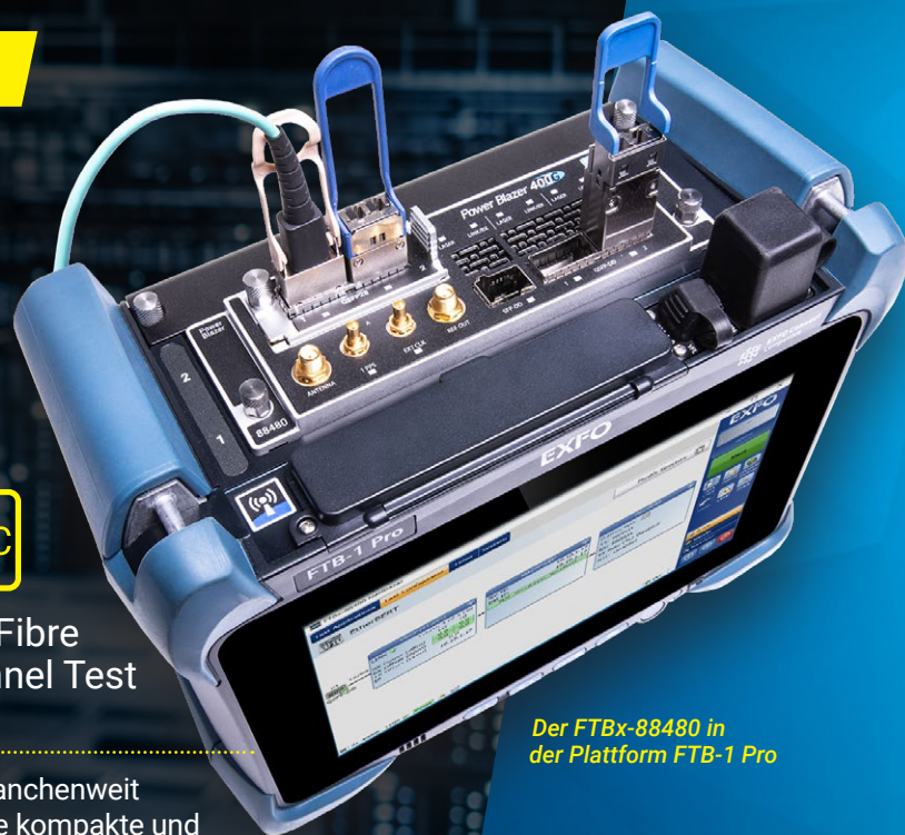
Der FTBx-88480 in der Plattform FTB-1 Pro

Die branchenweit einzige kompakte und portable Testlösung für 64G Fibre Channel. Verfügbar am FTBx-88480 und FTBx-88482.